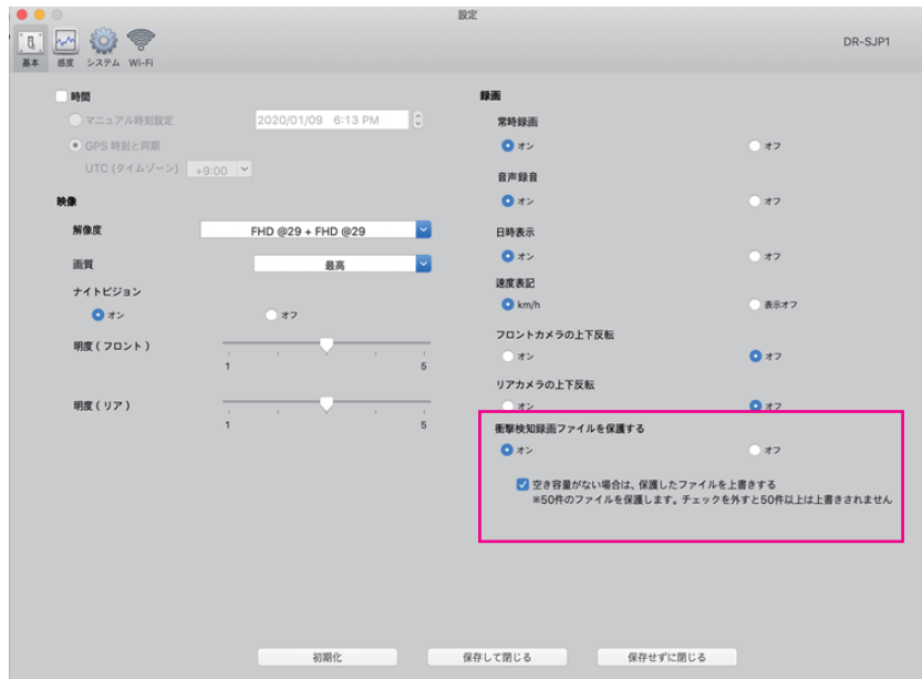
Mac 版 PC ビューワー